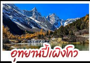
อุทยานป่าเขื่อนโกว

อุทยานสัตว์ป่า - อุทยานป่าเขื่อนโกว - อุทยานจิวจ้ายโกว รถไฟความเร็วสูง - EASTERN SUBURB MEMORY ถนนโบราณความงาม - วัดต้าซือ ช้อปปิ้งย่านคัง ถนนไท่กู่หลี่ + ถนนซุนซิว