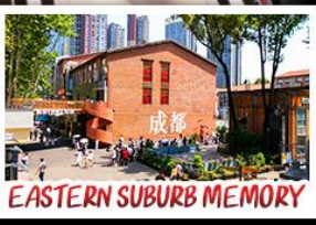
EASTERN SUBURB MEMORY