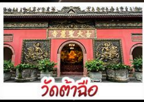
วัดต้าซือ