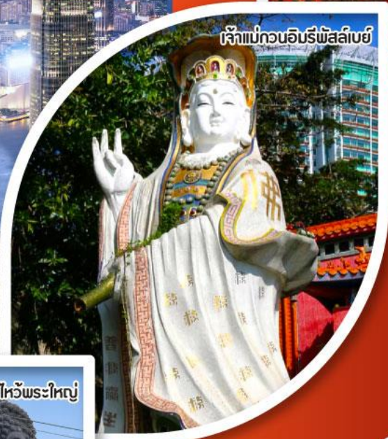
เจ้าแม่กวนอิมรีพีลเบย์