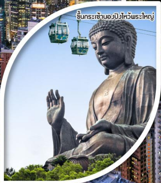
ซันกระเซานองปิงไหว้พระใหญ่