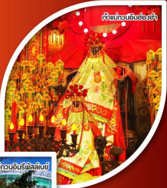
เจ้าแม่กวนอิมฮ่องอ่า