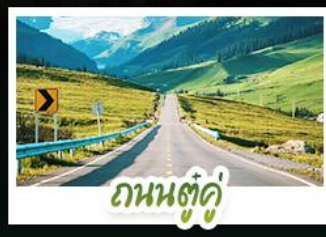
ถนนสู่คู่