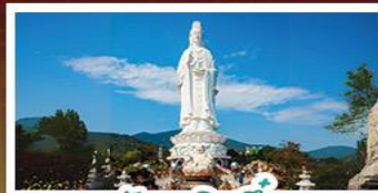
วัดเขลิเอ็ง