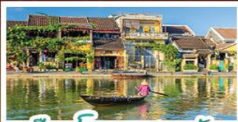
เมืองโบราณเฮอจอัน

! พักบนบาน่าฮิลล์ 1 คืน ! สัมผัสอากาศเขียบตลอดปี สโตร์ฝรั่งเศสสุดคลาสสิก - นั่งกระเช้ายาวที่สุด สูบานาฮิลล์ สนุกสุดมันส์ไปกับสวนสนุก The Fantasy Park นมัสการเจ้าแม่กวนอิมองค์ใหญ่ที่สุดของเมืองดานัง - เชิควินเมืองมรดกโลกฮอยอัน - สนุกสนานไปกับกิจกรรม!!นั่งเรือกระด้ง หมู่บ้านกัมทาน เชิควินร้านกาแฟ SON TRA MARINA CAFE - ไม่ลงร้านช้อปปิ้ง - อิ่มอร่อยกับบุฟเฟ่ต์นานาชาติ , หม้อไฟซีฟู้ด