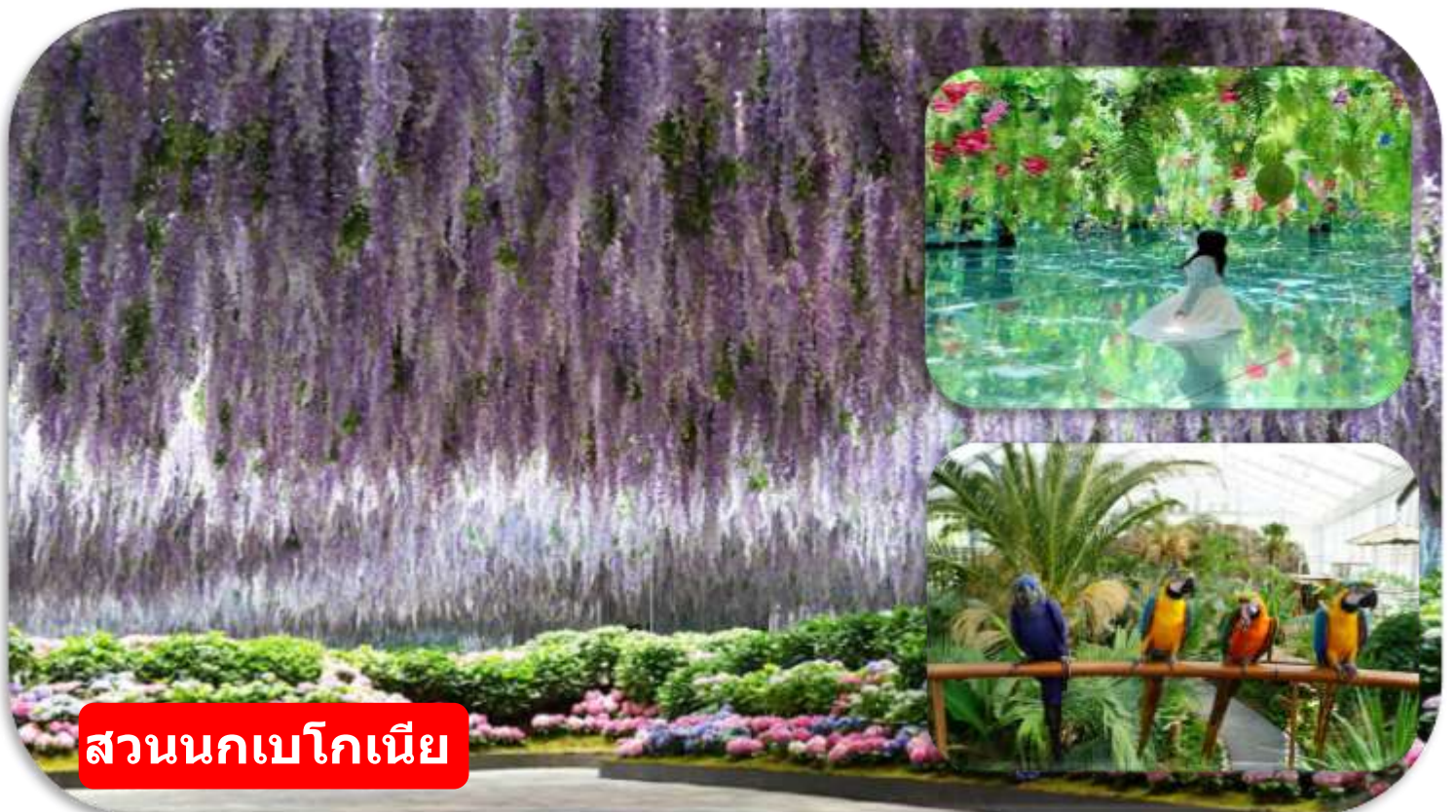
สวนนกเบโกเนีย

สวนนกเบโกเนีย เมืองดาพยอง (Begonia Bird Park) สวนธรรมชาติและเรือนกระจกขนาดใหญ่ที่ผสมผสานโลกของดอกไม้และสัตว์ปีกไว้อย่างลงตัว ภายในสวนจัดแสดง ดอกเบโกเนียหลากหลายสายพันธุ์สีสันสดใสตลอดทั้งปี ให้ท่านจะได้เพลิดเพลินกับการเดินชมสวนดอกไม้ พร้อมใกล้ชิดกับนกสายพันธุ์ต่าง ๆ