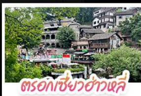
ตรอกเซียวฮ่าวหลี่