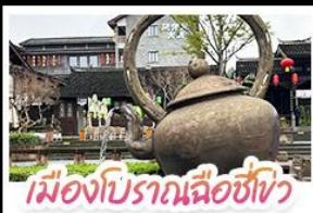
เมืองโบราณฉือชิว