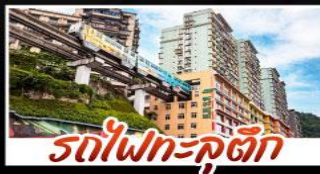
รถไฟทะลุคู้ตัก