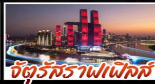
จัตุรัสราฟเฟิลส์