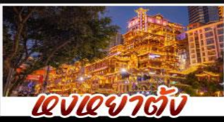
แสงอาคารตั้ง

สัมผัสประสบการณ์เที่ยวจีนแบบเต็มอิ่ม ทั้งความล้ำสมัยของมหานครชงชิ่ง และความงดงามตระการตาของธรรมชาติที่อุ้หลง ทุกการเดินทางเต็มไปด้วยความสะดวกสบายและคุ้มค่าเกินราคา!