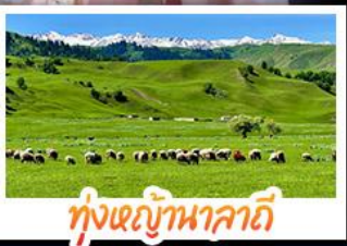
ทุ่งหญ้าบานาเลตี้