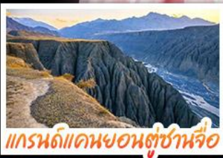
แกรนด์แคนยอนตู่ชานจื่อ