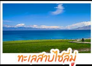
ทะเลสาบไซลี่มู่

หุบเขาดอกท้อ - ทะเลสาบไซลี่มู่ แกรนด์แคนยอนตู่ชานจื่อ - ทุ่งหญ้าบานาเลตี้