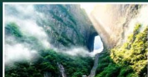
เขาประตูลำธาร