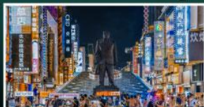
ถนนแดนแดนเซี่ยงซี