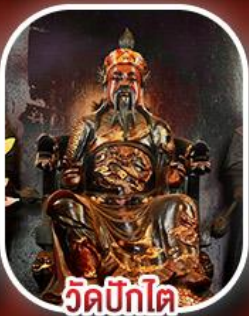
วัดปิกไต่