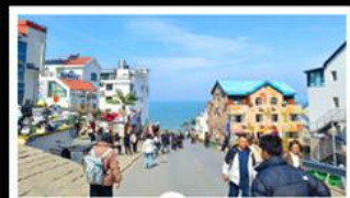
ถนนคอปเพิลิงหมายเลข 8

สัมผัสความยิ่งใหญ่ของ 4 เมืองสำคัญ ชิงเต่า - เยียนโก - เฟิงไห่ - เว่ยไห่ ปาต้ากวน - โบสถ์คาทอลิก - ตึกเก่าริมหา