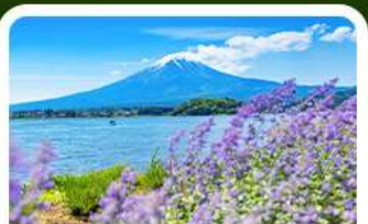
สวนโอะอิชิ ปาร์ค