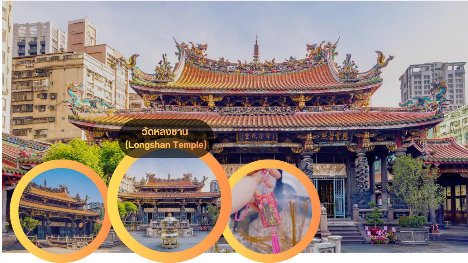
วัดหลงซา (Longshan Temple)

กลางวัน รับประทานอาหารกลางวัน (มือที่ 8) *เสี่ยวหลงเปา*