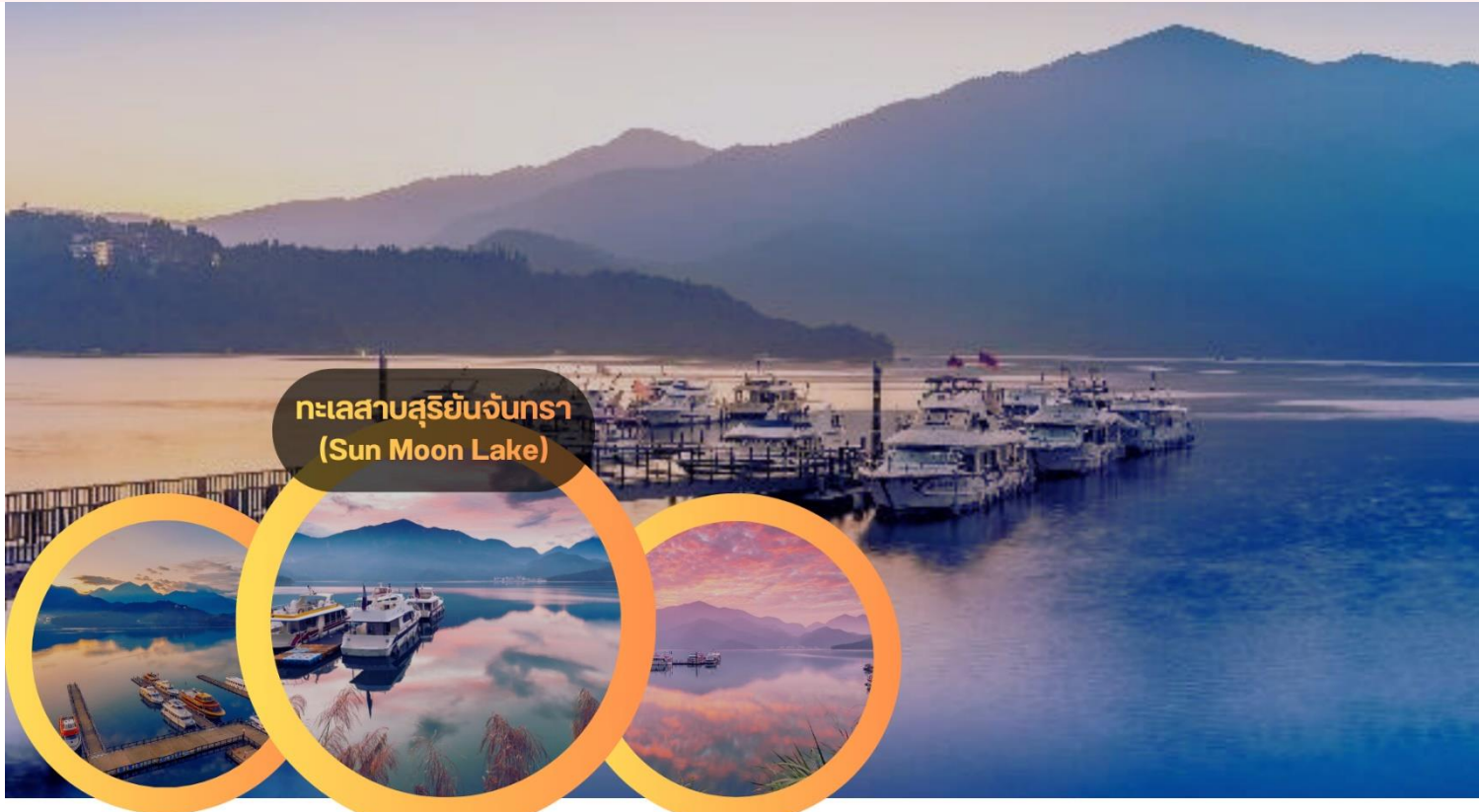
ทะเลสาบสุริยันจันทรา (Sun Moon Lake)

ปิดท้ายวันด้วยการเดินทางสู่ กรุงเทพฯ หลังจากนั้นนำท่านเดินเล่นที่ ตลาดซีเหมินติง (Ximending) – ศูนย์รวมแฟชั่นและวัฒนธรรมสตรีทฟู้ด ย่านซีเหมินติง ตั้งอยู่ใจกลางกรุงเทพฯ เป็นพื้นที่ที่มีคุณค่าทางวัฒนธรรมและสังคมเมือง ย่านพาณิชย์กรรมและวัฒนธรรมร่วมสมัย ของไต้หวัน มีประวัติศาสตร์ยาวนานตั้งแต่สมัยญี่ปุ่นปกครองทำให้สถาปัตยกรรมและสภาพแวดล้อมสะท้อนถึงความหลากหลายทางวัฒนธรรมและพัฒนาการทางเศรษฐกิจของเมือง นอกจากนี้ยังเป็นศูนย์กลางของ แฟชั่นสตรีทและศิลปะร่วมสมัย ที่ดึงดูดนักศึกษาและวัยรุ่นให้เข้ามาแลกเปลี่ยนวัฒนธรรมและไอเดียใหม่ ๆ แหล่งช้อปปิ้งและสตรีทฟู้ดยอดนิยม เพลิดเพลินกับการเลือกซื้อสินค้าแฟชั่นทันสมัย, ของฝากแก่ ๆ และเครื่องสำอางแบรนด์ท้องถิ่น พร้อมลิ้มรส อาหารสตรีทฟู้ดชื่อดังของไต้หวัน เช่น ของทอด ขนมหวาน และเครื่องดื่มท้องถิ่น บรรยากาศคึกคักยามค่ำคืน เสียงดนตรีและแสงไฟนีออน ทำให้ซีเหมินติงเป็น จุดหมายสุดสนุกที่รวมแฟชั่น อาหาร และวัฒนธรรมเข้าด้วยกัน ความมีชีวิตชีวาของไทเปเต็มเต็มทุกโมเมนต์แห่งความสนุกและความประทับใจ