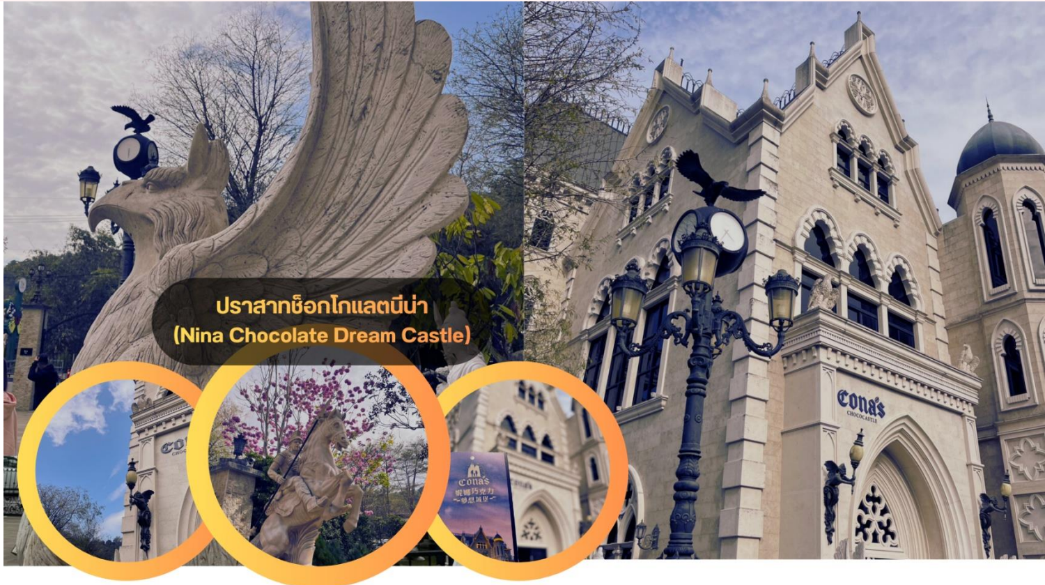
ปราสาทช็อกโกแลตนิน่า (Nina Chocolate Dream Castle)

พาท่านเสริมสิริมงคลที่ วัดเหวินหวู่ (Wenwu Temple) วัดศักดิ์สิทธิ์ที่สุดแห่ง "สุริยันจันทรา" สัมผัสพลังความศักดิ์สิทธิ์ที่รวมเทพเจ้าฝ่ายบุนและปู้ไว้ในที่เดียว! ขอพรเรื่องสติปัญญาและการเรียนจาก ท่านขงจื้อ พร้อมขอโชคลาภ การงาน และความซื่อสัตย์จาก เทพเจ้ากวนอู นั่นจากนี้วัดแห่งนี้ยังมีจุดสถานที่ของความขลังและพลังอันศักดิ์สิทธิ์ เริ่มจากหน้าวัดมีสิ่งโตหินอ่อนสีแดง คู่ยักษ์หน้าวัดที่ใหญ่ที่สุดในไต้หวันเพื่อปัดเป่าสิ่งชั่วร้าย. บันได 366 ขั้น: เปรียบเสมือนจำนวนวันใน 1 ปี (รวมปีอธิกสุรทิน). กระดิ่งขอพร: นักท่องเที่ยวนิยมซื้อกระดิ่งตามปีนักษัตร เขียนคำอธิษฐานแล้วนำไปแขวนไว้ตามชั้นบันไดวันเกิดของตน. วิหาร 3 ชั้น: แบ่งเป็นวิหารหน้า (เทพเจ้าแห่งโชคลาภ), วิหารกลาง (เทพเจ้ากวนอูและจ๊กฮุย) และวิหารหลัง (ท่านขงจื้อ).