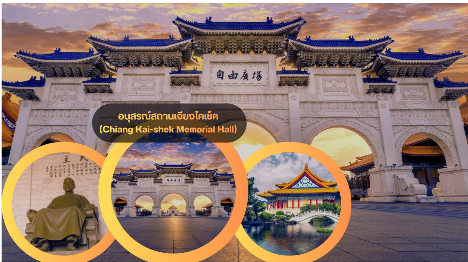
อนุสรณ์สถานเจียงไคเช็ก (Chiang Kai-shek Memorial Hall)

***หมายเหตุ: ตั้งแต่วันที่ 15 กรกฎาคม 2567 เป็นต้นไป กระทรวงวัฒนธรรมได้หวั่นได้ประกาศยกเลิกพิธี “เปลี่ยนเวรของทหารรักษาการณ์ ที่บริเวณหน้ารูปปั้นท่านนายพลเจียงไคเช็ก ที่มีขึ้นทุก 1 ชั่วโมง บนชั้น 4 ของอนุสรณ์สถานแห่งนี้”