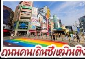
ถนนคนเดินซีเหมินติง