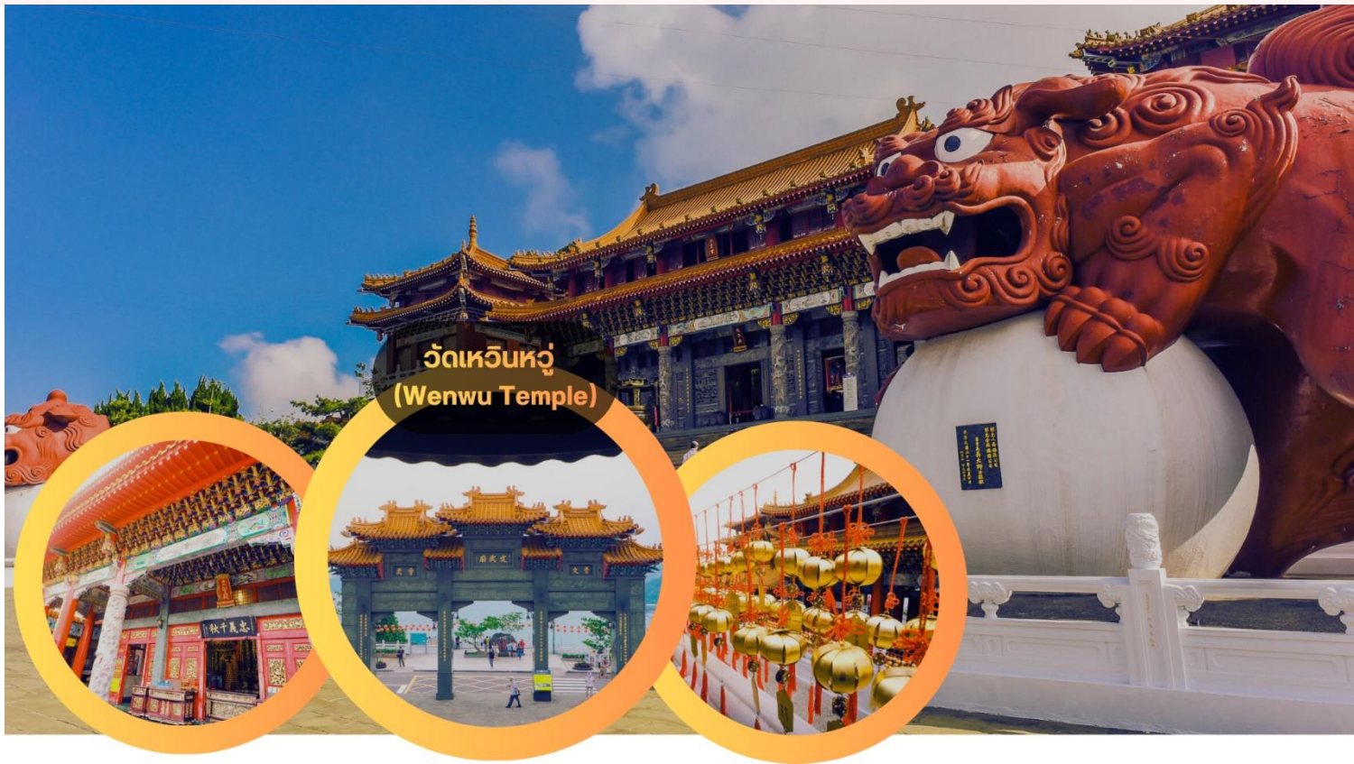
วัดเหวินหวู่ (Wenwu Temple)