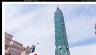
ตึก TAIPE 101