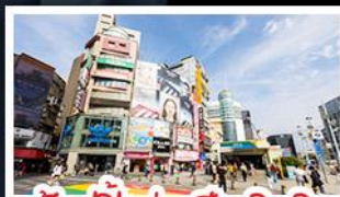
ช้อปปิ้งย่านซีเหมินติง