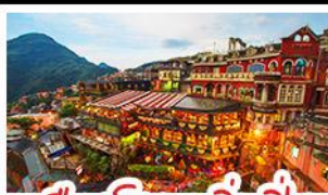
เมืองโบราณจิวเฟิ่น

เที่ยวเมืองธรรมชาติ วัดคนธรรม และมหานครไทเป ล่องเรือทะเลสาบสุริยันจันทรา เติมน้ำจิวเฟิ่น ช้อปปิ้งไม้อันตลาดซีเหมินติง โรงละครโกโจง STREET FOOD ระดับ MICHELIN GUIDE