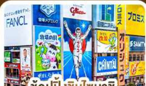
ช้อปปิ้งชินโซบาชิ และโดตงโบริ