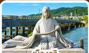
เมืองอจิจิ สวรรค์คนรักชาเขียว