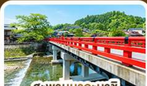
สะพานนากะบาชิ ทาคายาม่า