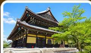
วัดนันเซ็นจิ