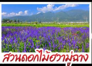
สวนดอกไม้ฮัวจ้าวู๋ฉ่าง