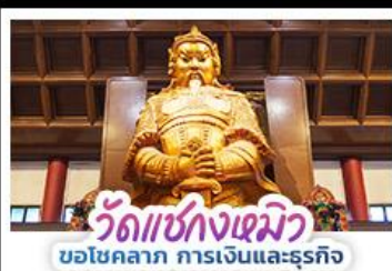
วัดแห่งกงเหมียว ขอโชคกลาง การเงินและธุรกิจ