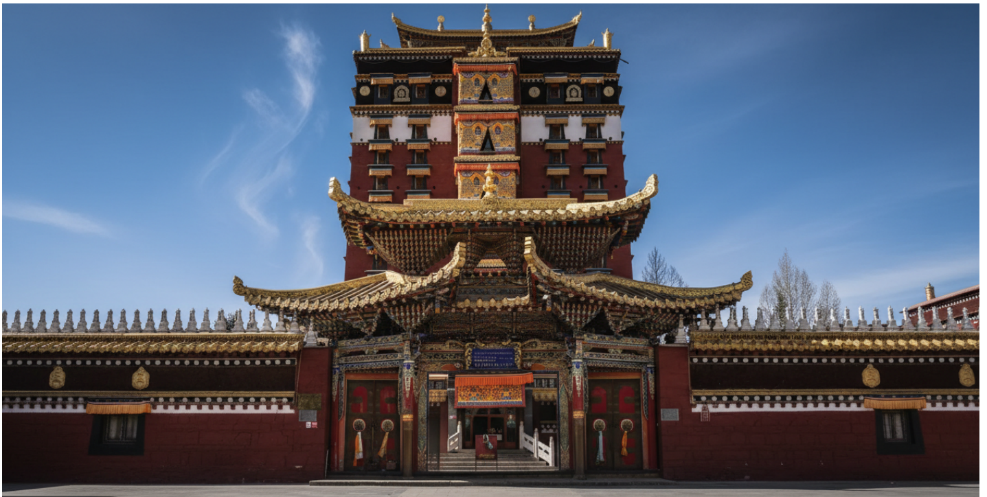
บ่าย นำท่านเดินทางสู่ หอพระมิลารปะ (ระยะทาง 134 ก.ม. ใช้เวลาเดินทางประมาณ 2 ชั่วโมง) สู่ใจกลางศรัทธา หอพระ 9 ชั้น มิลารปะ สถาปัตยกรรมทางพุทธศาสนาที่น่าอัศจรรย์ใจและเป็นหนึ่งเดียวใน