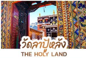
วัดลาปูหลง THE HOLY LAND

หนึ่งศรัทธา: สัมผัสความสงบและสถาปัตยกรรมทิเบตที่ วัดลาปูหลง หนึ่งผืนหญ้า: ส่องลอยไปในความเขียวจีของทุ่งหญ้าชางเคอ หนึ่งสายน้ำ: ค้นพบความงามเหนือกาลเวลาที่ จิวจ้ายโกว