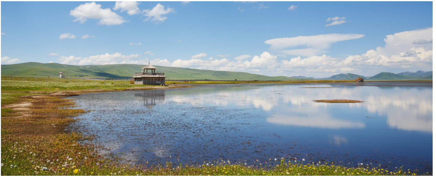
กลางวัน รับประทานอาหารกลางวัน ณ ภัตตาคาร (เมื่อที่ 17)

ขจี อากาศที่นี่บริสุทธิ์และบางเบา มีเพียงเสียงลมที่พัดผ่านยอดหญ้าและเสียงนกน้ำที่ขับขานเป็นท่วงทำนองแห่งธรรมชาติ บรรยากาศอันเงียบสงบจะชะล้างความเหนื่อยล้าให้หมดสิ้นไปในทันที ทะเลสาบแห่งนี้ไม่ได้เป็นเพียงความงดงามทางสายตา แต่ยังเป็นพื้นที่ชุ่มน้ำอันอุดมสมบูรณ์และมีความสำคัญยิ่งต่อระบบนิเวศบนที่ราบสูงทิเบต ถือเป็นแหล่งพักพิงและสวรรค์ของเหล่ากอพยพนานาชนิด โดยเฉพาะอย่างยิ่ง "นกกระเรียนคอดำ" สัตว์ปีกสง่างามอันเป็นสัญลักษณ์แห่งความสุขและอายุยืนยาวในวัฒนธรรมทิเบต ในช่วงฤดูร้อนทุ่งหญ้ารอบทะเลสาบจะผลิดอกไม้ป่านานาพรรณ กลายเป็นภาพวาดสีสันสดใสที่ธรรมชาติรังสรรค์ขึ้น เชิญท่านทอดน่องไปตามสะพานไม้ที่ทอดยาวเหนือผืนน้ำ สูดอากาศอันแสนสดชื่นให้เต็มปอด พร้อมเก็บภาพความประทับใจของผืนน้ำจรดขอบฟ้า ที่ซึ่งฝูงปศุสัตว์ของชาวทิเบตพื้นเมืองกำลังเล็มหญ้าอย่างอิสระอยู่ไกลๆ