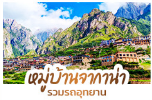
หมู่บ้านจากาน่า รวมรถอุทยาน