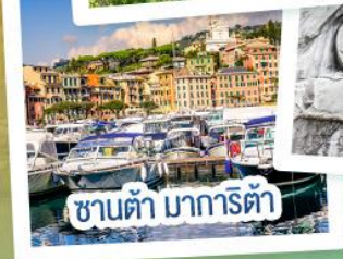
ซานต้า มารีต้า