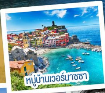
หมู่บ้านเวอร์นาซซา