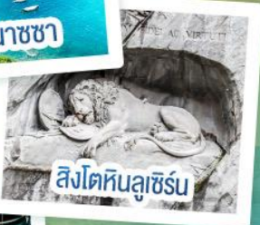
สิงโตหินลูเซิร์น