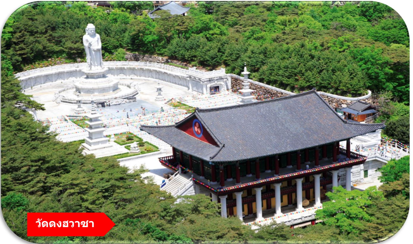
วัดดงฮวาซา