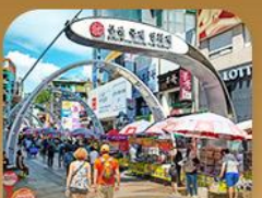
ตลาดนัมโพดง