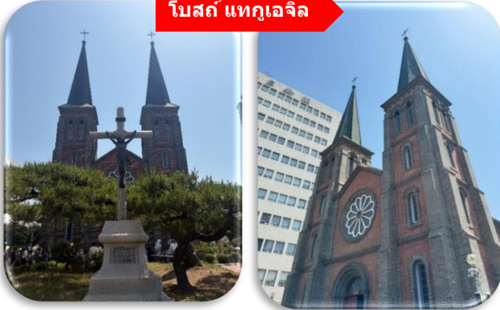
โบสถ์ แทกูเจ็ล

นำท่านเที่ยวชม โบสถ์แทกูเจ็ล โบสถ์นิกายโปรเตสแตนต์ที่เก่าแก่ที่สุดใน จังหวัดคย็องซ็องบุก (Gyeongsangbuk-do) ตั้งอยู่ในบริเวณ Cheongna ซึ่งเป็นย่านที่อยู่อาศัยของเหล่ามิชชันนารีที่มาอาศัยอยู่ใน เมืองแทกู