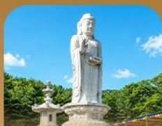
วัดดงซาซา

เปิดประสบการณ์เที่ยวเกาหลีสุดคุ้ม ปีครั้งเดียว เที่ยวสองเมือง • ชิกอินถนนนักร้องคิมควังซอก สัมผัสเสน่ห์ศิลปะและเสียงเพลง • นั่งรถไฟไปบุกเบิกชมวิวทะเลปูซาน • หมู่บ้านคิมชอนสีสดใส ก่อนเยือนวัดแฮดงยุงซาและวัดคยองซาซา เสริมความเป็นสิริมงคล • เวชชะทำเรือสีรุ้ง Bunezia ปิดท้ายด้วยชายหาดแฮอินแดและคัมบาร์กช็อดัง พร้อมเดินช้อปปิ้ง Walking Street สุดฟิน