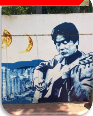
ถนนคิมควังซอก

นำท่านเที่ยวชม ถนนคิมควังซอก เป็นถนนสายเล็ก ๆ สดอบรื่นในเมืองแทกู ที่สร้างขึ้นเพื่อระลึกถึง คิมควังซอก นักร้องโฟล์กในตำนานของเกาหลีใต้ ผู้เกิดที่แทกูและเป็นศิลปินที่คนเกาหลียังคงรักมากจนถึงทุกวันนี้ เดิมทีบริเวณนี้เป็นกำแพงเก่าใต้ทางรถไฟ แต่ภายหลังถูกพัฒนาให้กลายเป็น "ถนนแห่งเสียงเพลงและความทรงจำ" ตลอดทางจะเต็มไปด้วยภาพวาดกราฟฟิตี้ รูปปั้นของคิมควังซอก งานศิลปะและมุมถ่ายรูปแนววินเทจ เส้นห์ของถนนนี้ไม่ใช่ความอลังการ แต่เป็นความรู้สึก "อบอุ่นและมีเรื่องราว" คาเฟ่ ร้านดนตรี และบรรยากาศย้อนยุค