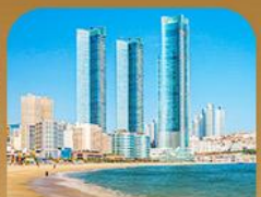
หาดแฮอินแด