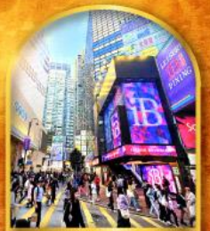
ช้อปปิ้งจุใจย่านจิมซาจุ่ย