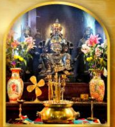
วัดปึกโต