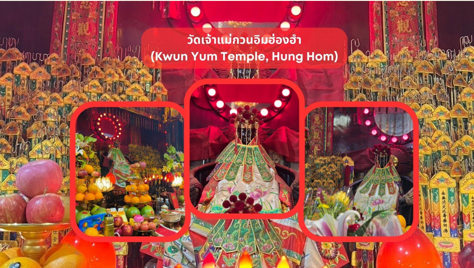
วัดเจ้าแม่กวนอิมฮ่องกง (Kwun Yum Temple, Hung Hom)

รับประทานอาหารเช้า ณ ภัตตาคาร บริการท่านด้วยเมนูติ่มซำฮ่องกง (มื้อที่ 2)