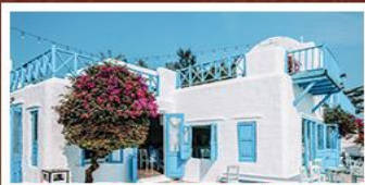
SON TRA MARINA CAFE