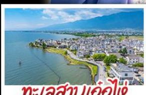
ทะเลสาบเอ๋อไห่