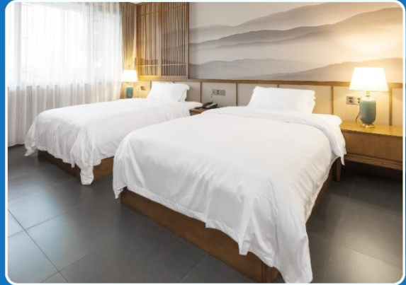
👤👤 TWIN (TWN)