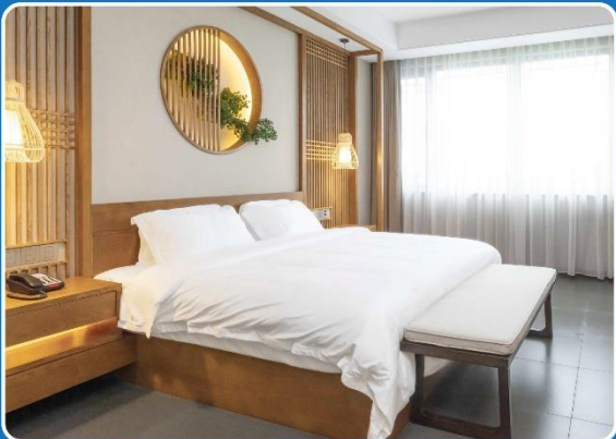
👤👤 DOUBLE (DBL)