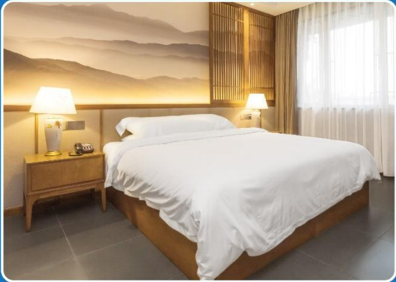
👤 SINGLE (SGL)