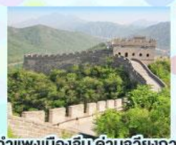
กำแพงเมืองจีน ด้านจวิยงกวน